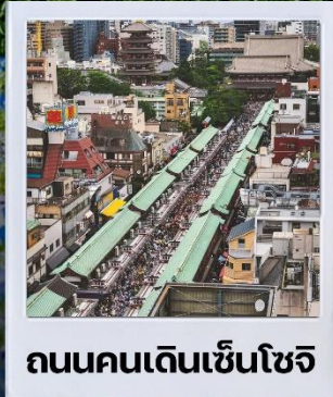
ถนนคนเดินเซ็นโซจิ

เดินทาง 5 วัน 4 คืน | วันที่ 2-6 พ.ย. 67