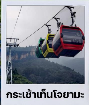
กระเช้าเท็นโจยามะ